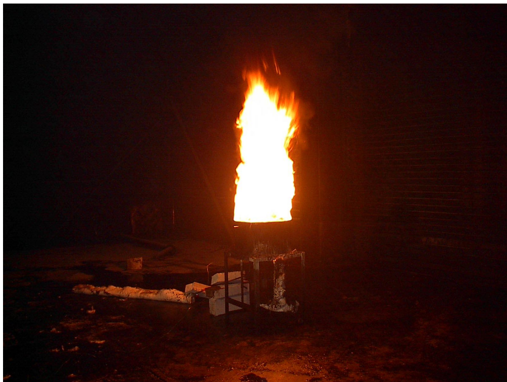
Foto 3.1: Brannen i soyaoljen ca 30 sekunder etter selvantennelse av soyaoljen. Diameteren til karet er ca 0,5 m. Flammehøyden var på dette tidspunktet ca 1,5 m.