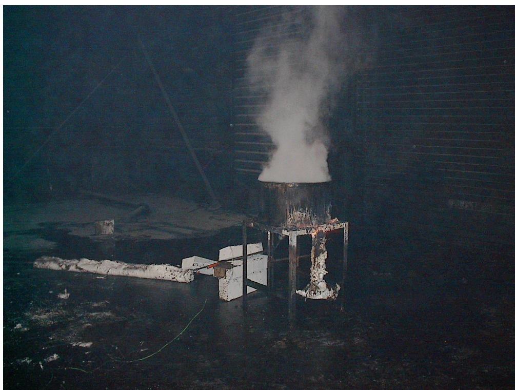
Foto 3.1: Avdamping av matolje når temperaturen på oljen var ca 360 °C, eller ca 30 sekunder før selvantennelse av oljen.

Foto 3.1 og 3.2 viser henholdsvis tilstanden i karet ca 30 sekunder før og etter selvantennelse av oljen. Det begynte å ryke av oljen når temperaturen passerte ca 300 °C, og røykproduksjonen økte gradvis inntil oljen selvtekte.